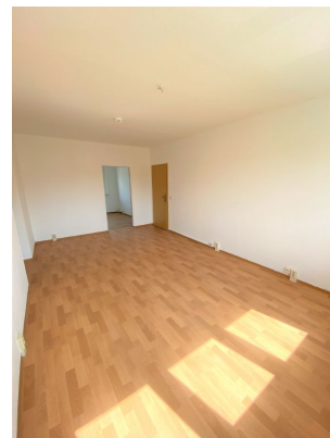
Alle Maße sind circa-Maße. Die gekennzeichneten Installationsanschlüsse können abweichen und sind in der Wohnung zu überprüfen!